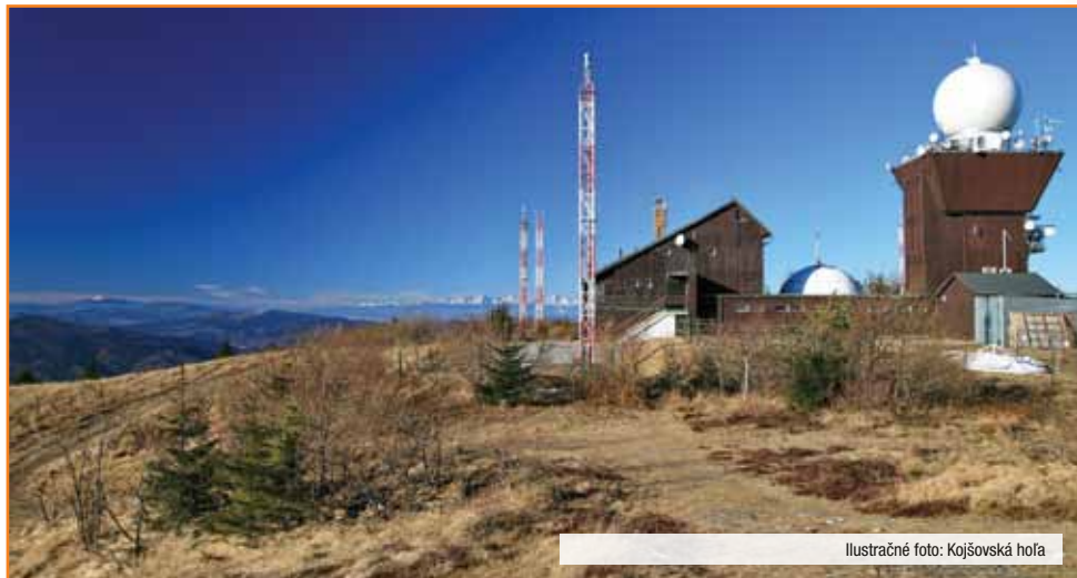
Ilustračné foto: Kojšovská hoľa

Centrom prevádzky v Košiciach bol v tom čase kanál 28. Práve tam bola zapnutá vysielacia v Allamat-e a sústreďovali sa tam aj prví CéBečkari. Na ďalších kanáloch fungovali taxislužby, donášky, strážnici, sta-