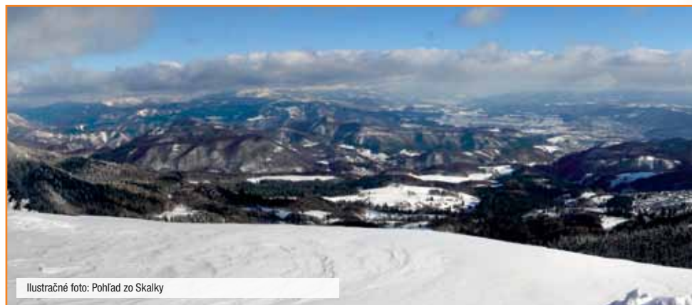
Ilustračné foto: Pohľad zo Skalky