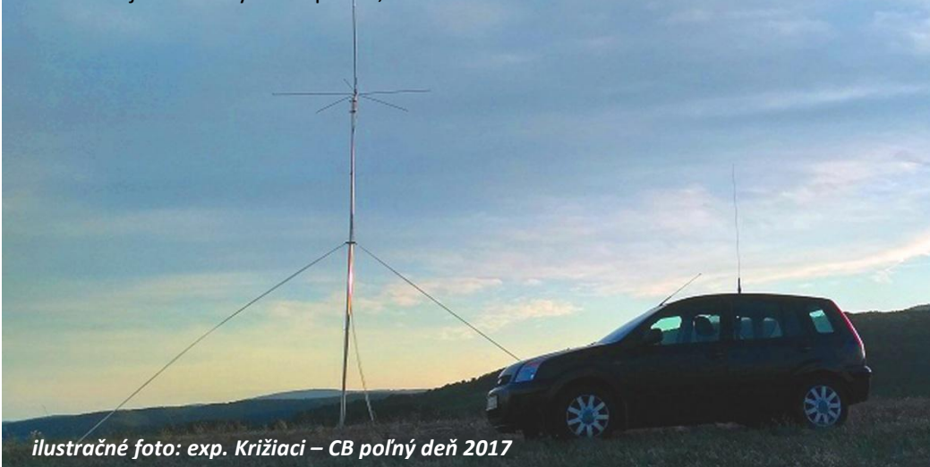
ilustračné foto: exp. Križiaci – CB poľný deň 2017

Vlani na 33 slovenských kopcoch a kopčekoch bolo 51 operátorov, z domácich QTH sa ozvalo takmer 100 voláčiek. Koľko nás bude tento rok?