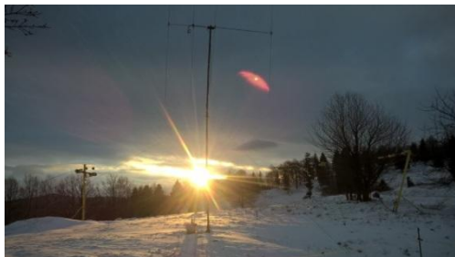
exp. Mafia /p Jančiarov kopec (JN98OM)