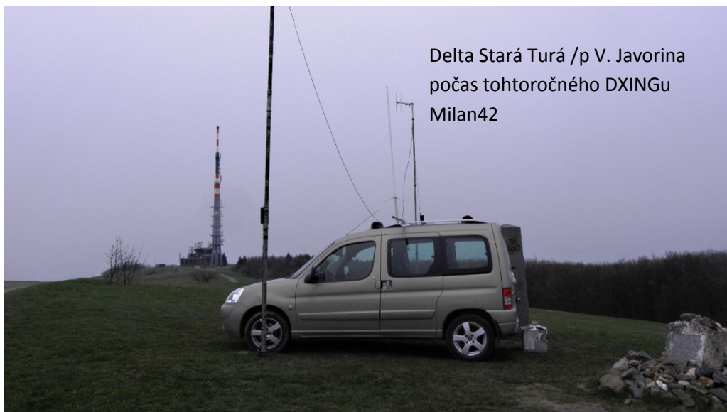
Delta Stará Turá /p V. Javorina počas tohtoročného DXINGU Milan42

Celkovo len 17 spojení na CB, ale aj tak všetkým ďakujem za zavolanie a spojenie. Ako som povedal pri spojení s Hiriburim Palárikovo. Kedysi som podľa prvého brejku spoznal operátora po hlase, dnes už pomaly neviem zapísať volačku.