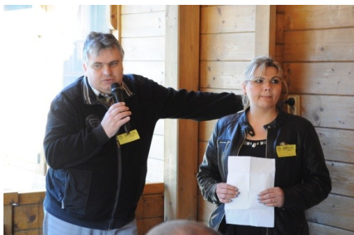
Nautilus (SK021) a Fatima Handlová (SK726)