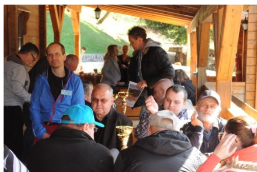
účastníci počas diskusie na terase chaty